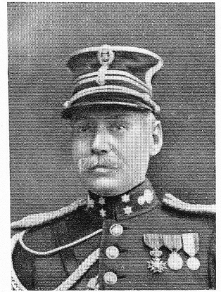
ANDRÉ, Pierre-Paul, né le 29 juin 1864, à Monceau (Ardennes).

Capitaine. Ord. Léop. Chargé au début de la guerre de missions périlleuses, fut, jusqu'au 7 octobre 1914, toujours assez heureux pour réussir; mais ce jour-là, assailli par des forces très supérieures, à Eecke-Nazareth, il tomba foudroyé sous les balles, avec cinq de ses gendarmes.